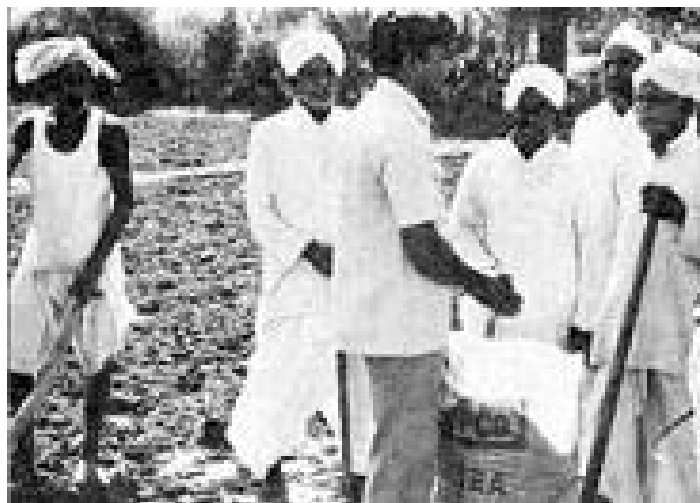
Сътрудник на IFFCO съветва индийски селяни във връзка с употребата на торове 12