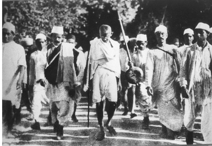
Ганди със своите 70 съмишленици тръгват на „Солен марш“.

Ганди мечтае хората да могат да живеят в своите села, като създават малко производство на основни средства за живот – храна и дрехи, като по този начин се самоосигуряват и постигат високо равнище на самодостатъчност. Той предлага т.нар. „Панчаяти Радж“ 7 , т.е. система за обществено устройство, която се състои от хиляди самоуправляващи се селища. Тясна икономическа основа трябва да станат малките производства, тъй като те предлагат възможност за пълна заетост, но и за устойчиво развитие на селските общности.