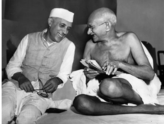
Джавахарлал Неру – първият министър-председател на независима Индия – ляво, и Махатма Ганди – ръководителят на движението за независимост – вдясно.

През 50-те години правителството започва реформи, при които едрите земевладелци са лишени на 60% от принадлежащата им селскостопанска земя в полза на селската беднота. Стотици милиони получават малки участъци земя с размер до 2 акра. Въпреки това около 20% от селските домакинства остават без собствена земя.